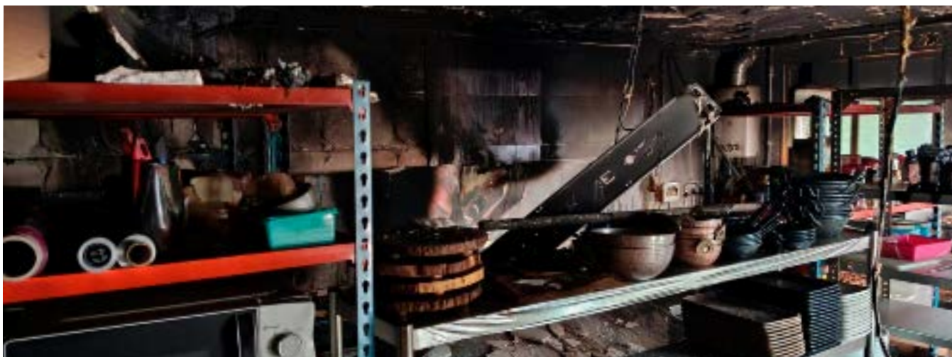
Estado de la cocina después del incendio

público-, ha tenido que tramitarse de manera urgente después de sufrir un aparatoso incendio en la mencionada cocina, lo que ha llevado al cierre del comedor usado tradicionalmente en la planta baja anexo a la barra y a la terraza, habilitando una cocina y un comedor de manera provisional en la primera planta del edificio con el fin de atender a los socios y usuarios habituales de este servicio, imprescindible hoy en día en Molina, durante los meses que duren las obras.