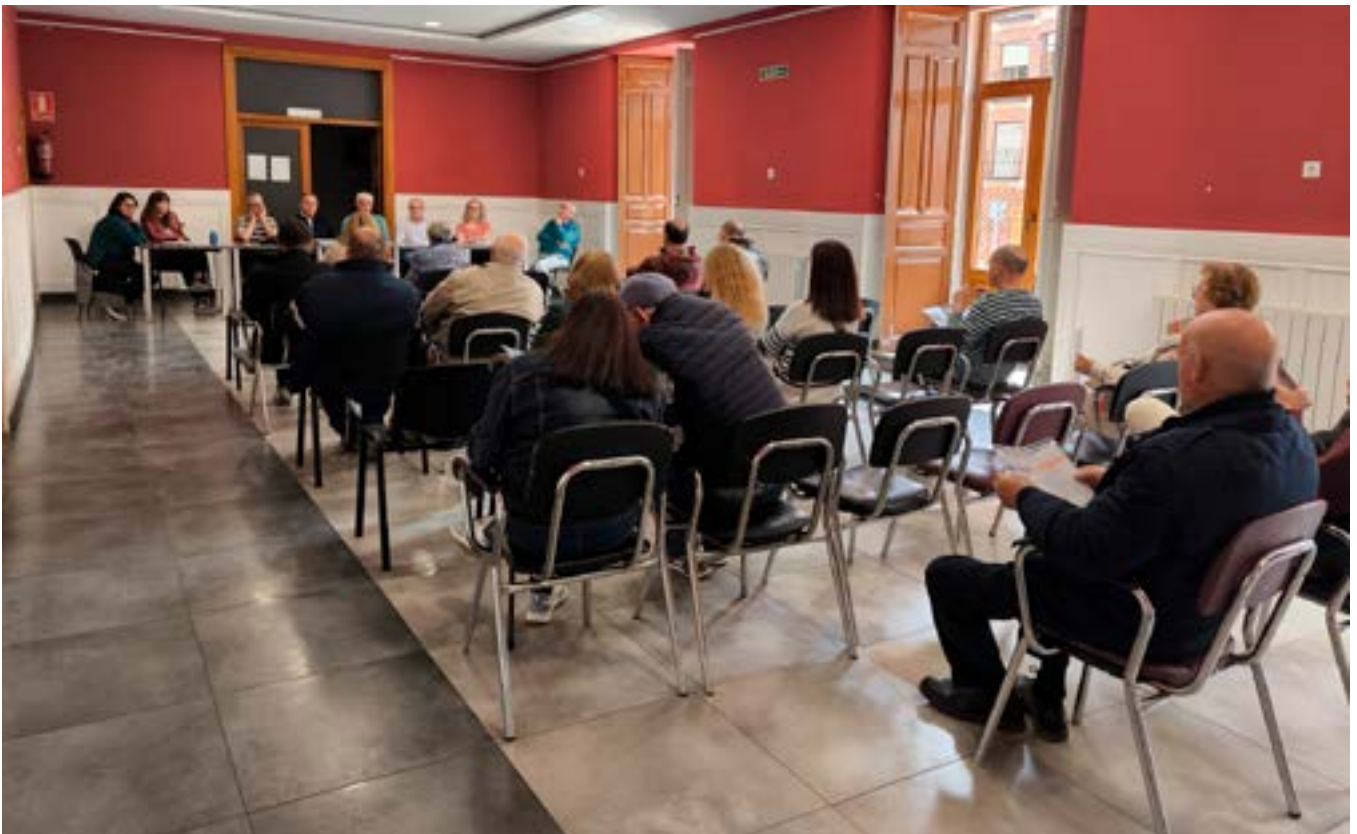
Asamblea General. Mayo 2026

La Junta Directiva de la Asociación "Casino de la Amistad" ha presentado en Asamblea General Extraordinaria el proyecto de acondicionamiento de la sede social, el Palacio de los Garcés de Marcilla, con el fin de realizar una importante actuación y adaptar la cocina a la exigente normativa legal actual para este tipo de instalaciones, además de otras medidas imprescindibles para un local de pública concurrencia como es nuestro caso.