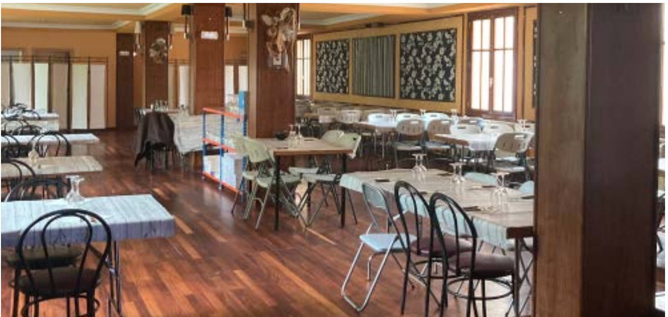
Salón habilitado como comedor en la planta primera

Esta obra, que estaba prevista y planificada por la Junta Directiva ante la perentoria necesidad de adaptar la cocina existente y la instalación eléctrica a la normativa legal -ya que se encontraba completamente desfasado en el tiempo con un riesgo real de clausura por parte de las autoridades sanitarias, por no cumplir con los requisitos que actualmente se exigen a este tipo de instalaciones de uso