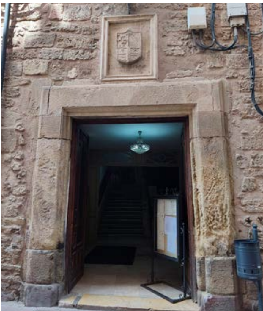
Palacio Garcés de Marcilla. Escudo familiar

y de suministro de agua, con el fin de dotar al casino de una cocina moderna, funcional y con la capacidad necesaria para atender la creciente demanda que actualmente tiene nuestra barra y restaurante.